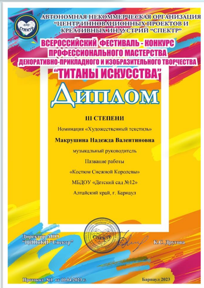
Всероссийский фестиваль-конкурс профессионального мастерства декоративно-прикладного и изобразительного творчества «Титаны искусства» – 2023 г. – диплом Лауреата 3 степени

Городской конкурс проектов «Исследую и практикую» - 2022 г. – Сертификат участника