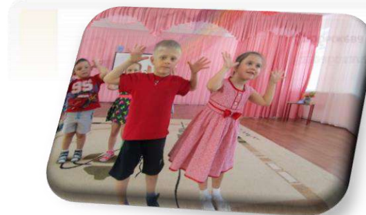
Дидактическая игра «Покажи эмоцию»